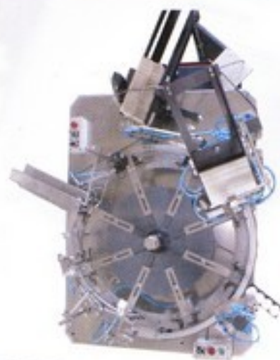
Introducción de Folletos