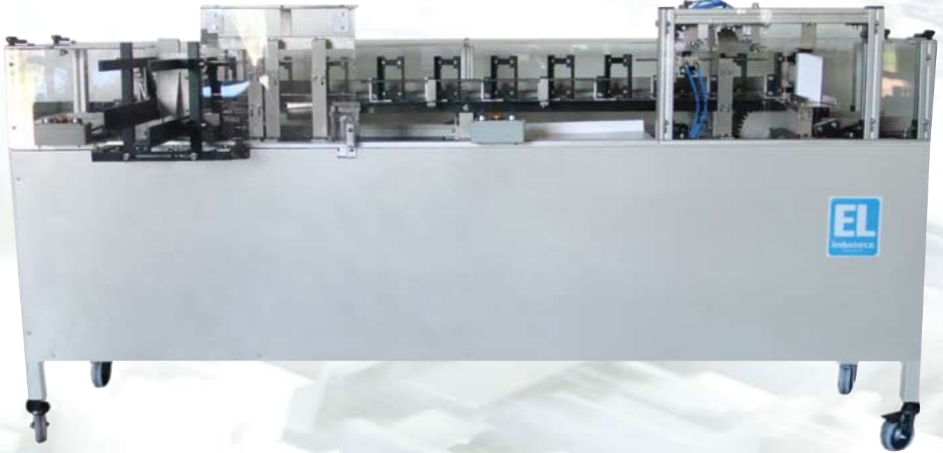
Vista de Arriba